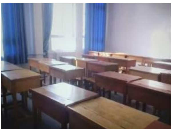
(1984-1986 年间, 秦皇岛煤校教室内掀盖式带倾斜面的学生学习课桌。)