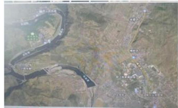
(2025 年位于秦皇岛市抚宁区上庄坨村的秦皇岛煤校旧址和半壁店村的谷歌地图。)

我琢磨着, 走着。不觉间, 来到了一块陡立的大石壁面前。我驻足观看, 又上前抚摸这块巨大石壁的一角。棕褐色的高耸的如斧削般的石壁上, 有三个描红的石刻大字: 半壁店。这是上庄坨村北边的一个邻居小村。