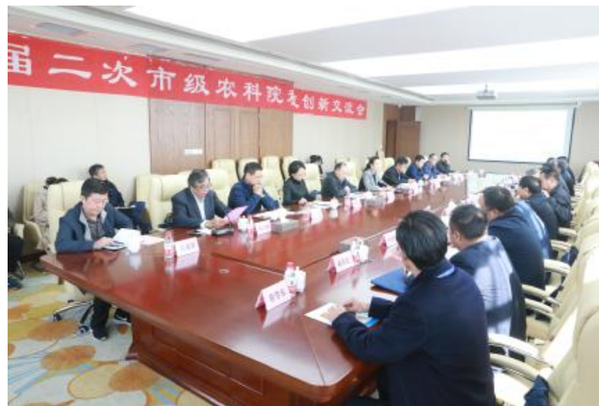
2018年10月11日河北省第三届第二次科技创新交流会会场

来自全省各地的农科院在科技创新、成果转化、服务社会等方面进行了深入的交流,并参观了我校产学研合作示范基地。秦皇岛电视台、秦皇岛日报分别对此次活动给予了报道。